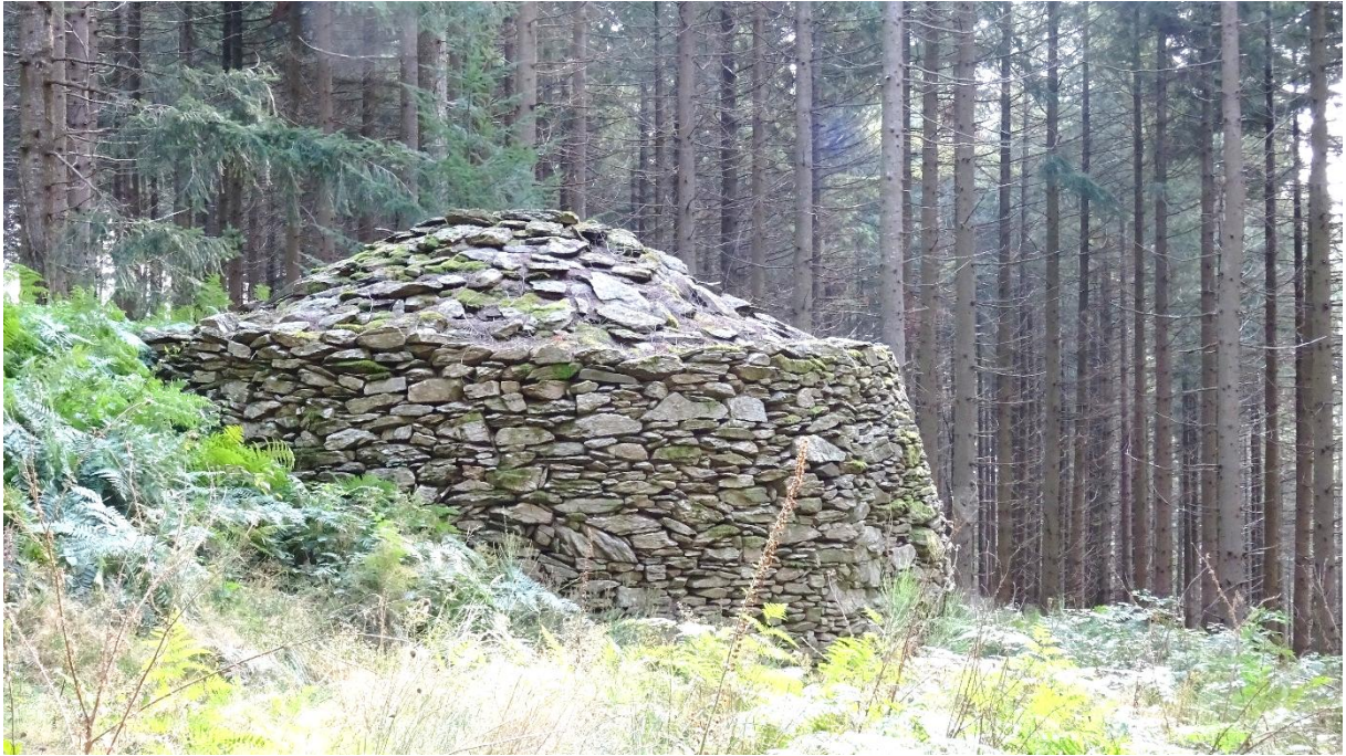
Fig. 12 Caselle, côté nord, dans les bois au-dessus de Jonquayrolles : elle est exceptionnelle par ses dimensions et le volume intérieur ainsi créé.