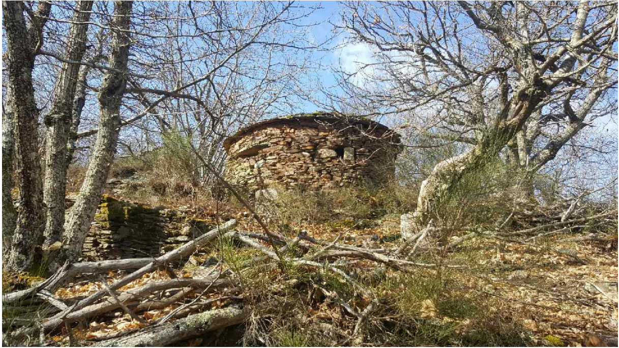
Fig. 14 Cette caselle, située à seulement 800 m d'altitude, dans une ancienne châtaigneraie, associe les schistes trouvés localement et quelques moellons de grès remontés des affleurements sous-jacents. Si nous sommes encore sur les contreforts du Lévézou, nous ne trouvons déjà plus de quilles de berger à ces altitudes. Les quilles de berger étaient réservées aux zones de parcours non boisées d'où l'on pouvait voir et être vu de loin !