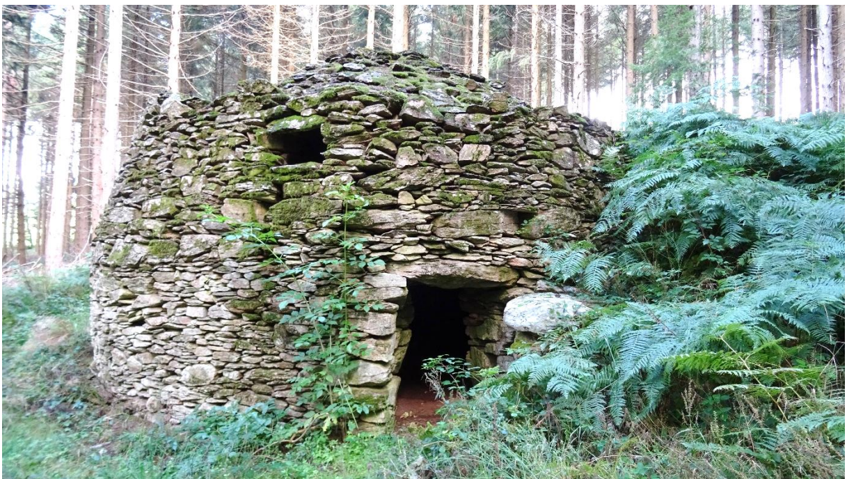
Fig. 13 La même caselle, côté sud, exposé au soleil (avant les plantations de résineux, bien sûr). Remarquer l'entrée mais également un jour pour éclairer la partie supérieure de la caselle.