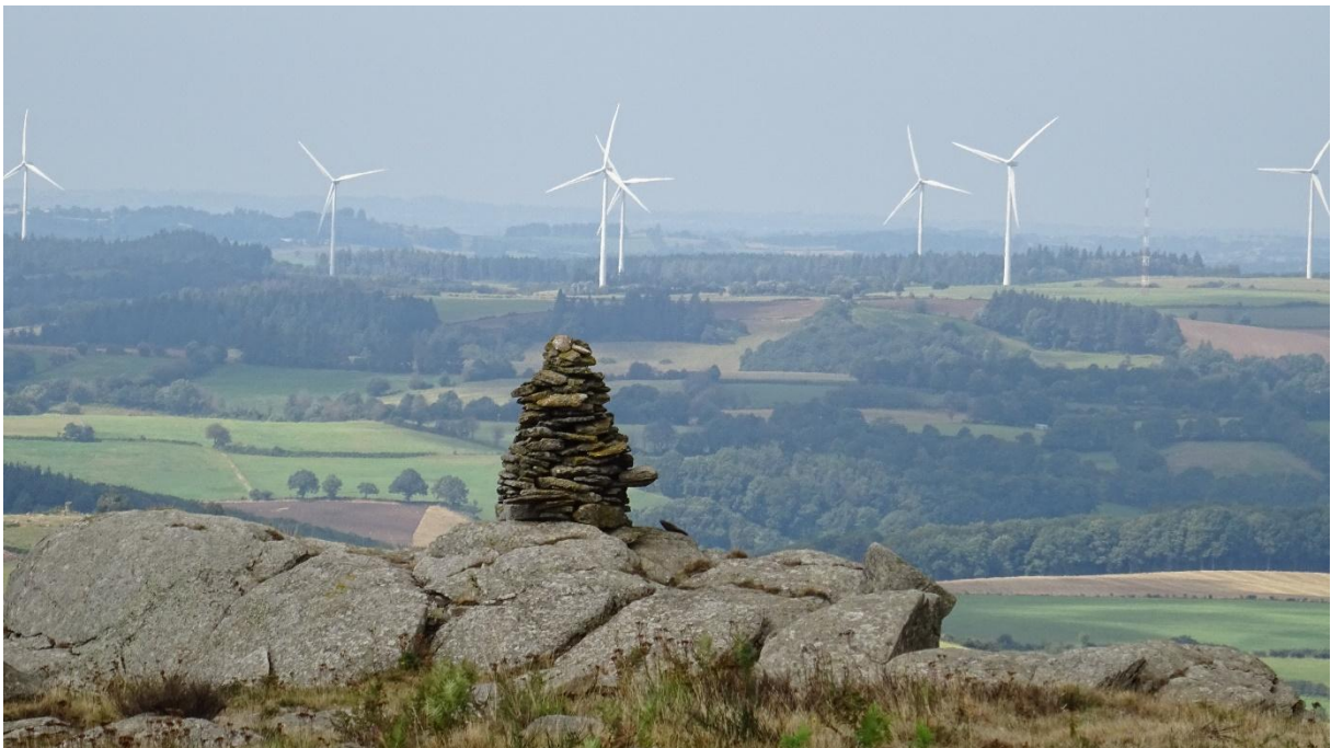
Fig. 7 Cette petite quille dressée à 1080 mètres sur de magnifiques affleurements de gneiss dominant la région des lacs... et des éoliennes... date des années 1980. Elle est l'œuvre, en plusieurs séances, de « jouves » qui ont expérimenté là leur sens de l'équilibre et de l'esthétique.