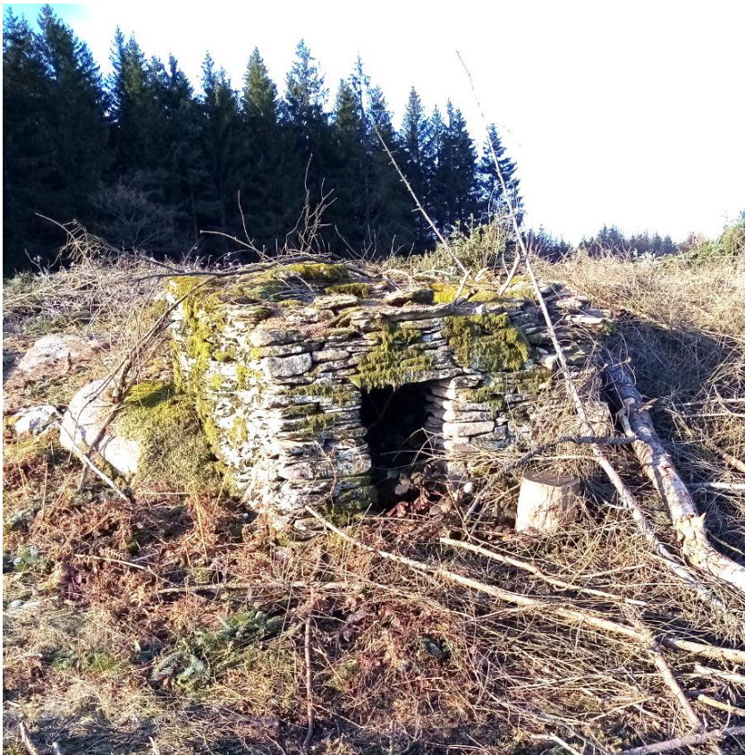
Fig. 11 Une belle caselle de section carrée près du relais de la Vernhette.

La caselle près du relais de la Vernhette est probablement celle évoquée dans un terrier (ancien cadastre) de la commune de Castelnau-Pégayrols en 1762 et qui servait de limite seigneuriale entre Montjoux et Castelnau : « du midy avec les terres de la communauté de Montjoux à une cazelle dite de Pétarelle batie au sommet de la montagne, et qui est divisoire des communautés » (source : Marc Vaissière, La montagne du Lévésou, 2009, p. 39).