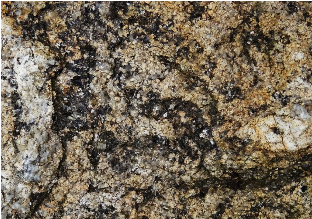
Le gneiss du Lévézou : tout un programme de textures et de couleurs...

Quilles et caselles du Lévézou sont construites en gneiss, avec la technique de la pierre sèche, sans aucun outil. Les quilles sont le plus souvent dressées sur les points culminants, elles en ponctuent les horizons qu'elles animent de leurs silhouettes si diverses. Certaines sont tombées... de vieillesse mais également, plus radicalement, à la suite de travaux d'épierreage mécaniques récents permis par la puissance de plus en plus grande des engins agricoles et la (re)mise en culture de hautes terres autrefois dédiées à l'élevage. Les caselles, quant à elles, se situent plus volontiers sur les versants exposés au sud. Les quilles et caselles du Lévézou situées dans notre commune ont eu bien plus de chance : elles ont trouvé, presque toutes, des propriétaires attentifs à leur pérennité. Qu'ils en soient remerciés.