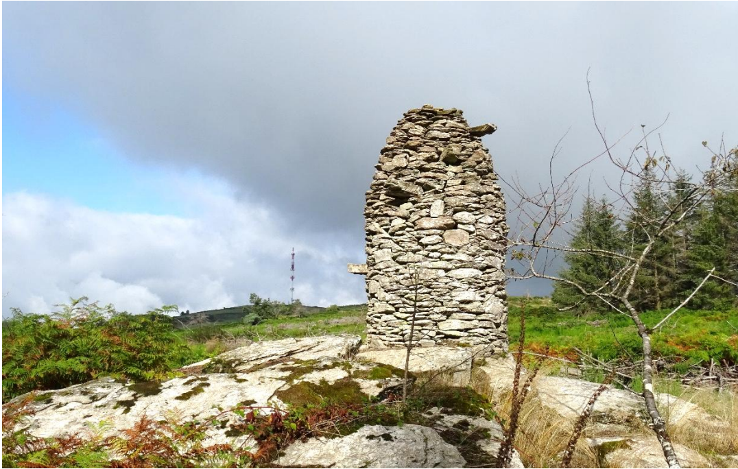
Fig. 10 La même après la coupe des résineux. Merci aux techniciens forestiers et à l'entreprise de bucheronnage d'avoir su l'épargner et lui redonner de l'air !

Les caselles sont plus répandues et en tout cas plus connues en domaine calcaire, sur tous les Grands Causses ainsi que les Avants-Causses. Dans la commune de Montjaux on peut voir des caselles élevées en calcaire Hettangien sur le causse de Concoules comme sur celui de Montgisty.