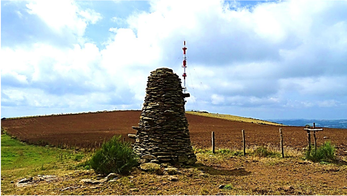
Fig. 3 Dialogue de sourd ? Qui sait ?