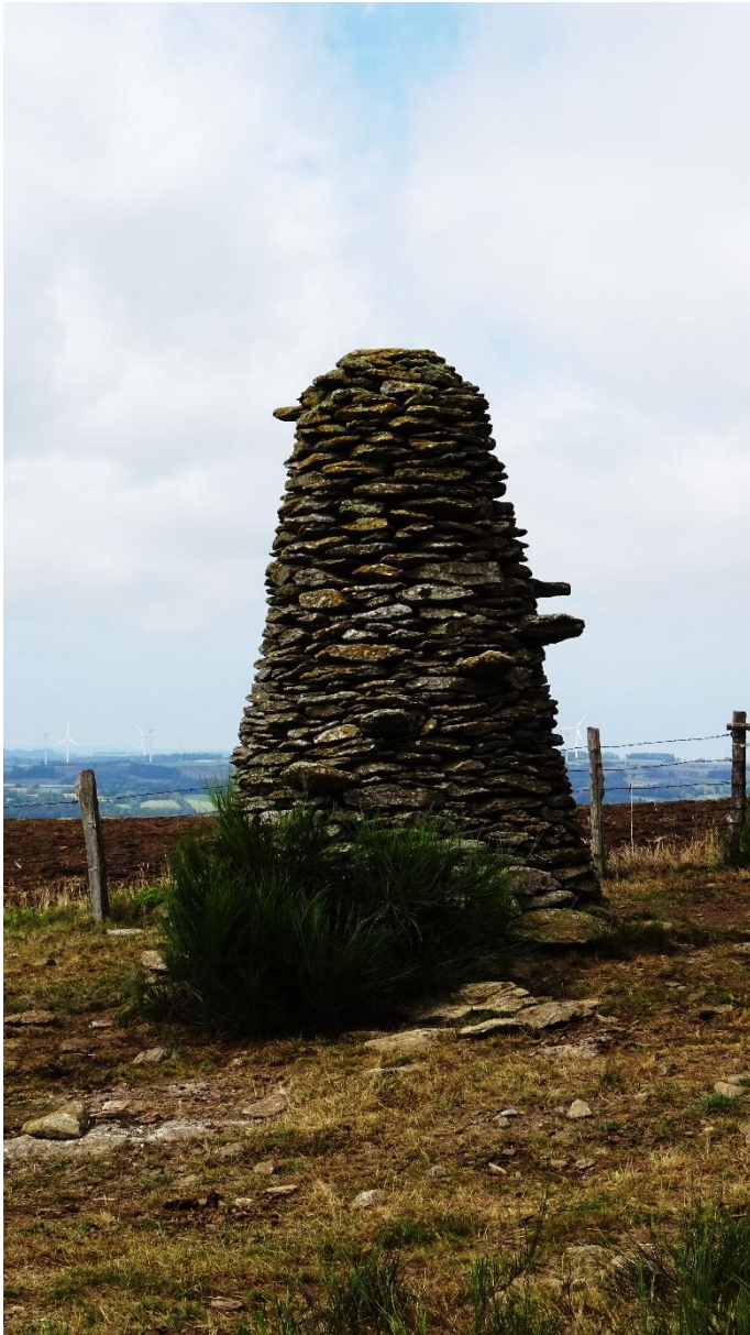
Fig. 2 Vue rapprochée. Gros plan sur les marches engagées dans la structure.