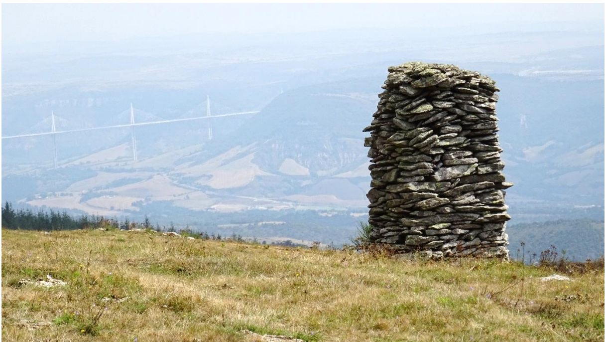
Fig. 5 La même surveillant, depuis ses 1075 mètres d'altitude, le viaduc de Millau...