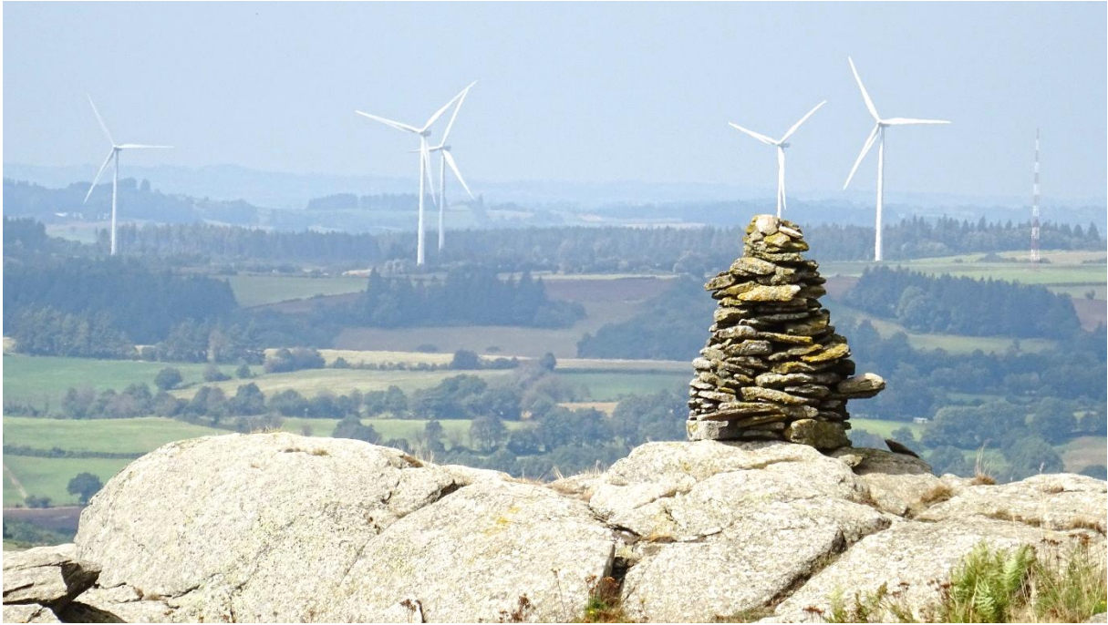
Fig. 8 Telle Don Quichotte ?